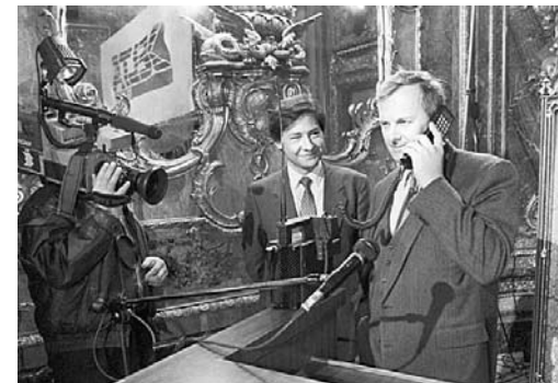
Анатолий Собчак общается по сотовому телефону с мэром Сиэтла. Начало всеобщей "мобилизации" России. Первый разговор по сотовому телефону в России состоялся на английском языке.

1991-й у многих связан только с ГКЧП. И мало кто помнит, что 9 сентября того же года состоялся первый в истории страны разговор по мобильному телефону, положивший начало бурному развитию такой связи в нашей стране.